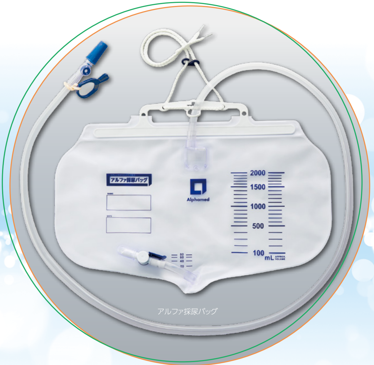
アルファ採尿バッグ